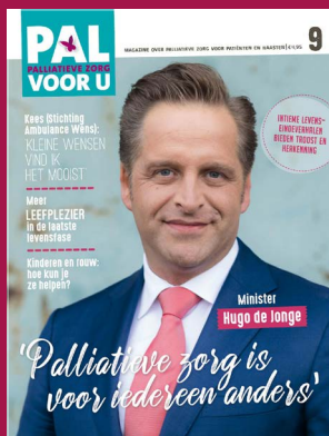
Cover Pal voor u (editie 9)