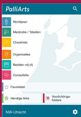
PalliArts, een app over palliatieve zorg