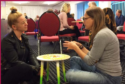
De verhalenkring: geef een draai aan je leven voor een goed gesprek