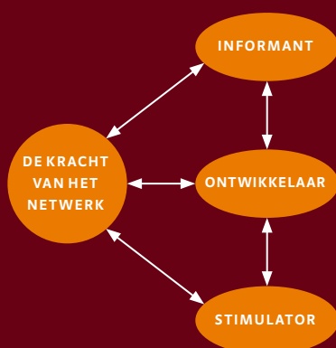
Drie rollen gedetecteerd

Concrete benoemde activiteiten worden in 2020 verder uitgewerkt.